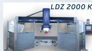
LDZ 2000 K